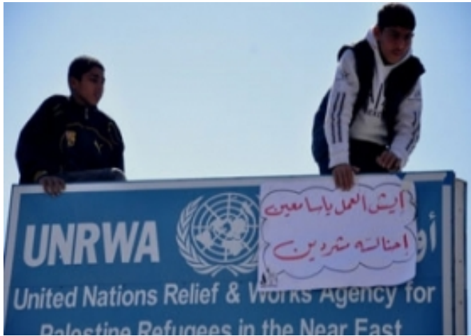
Proteste nella sede dell'UNRWA a