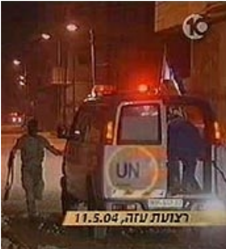
Un'ambulanza ONU usata dai miliziani nel 2004 a Gaza