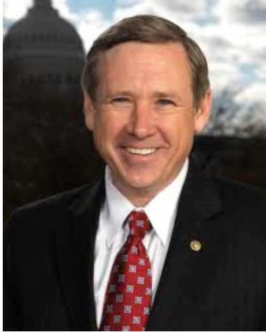
Il Senatore degli Stati Uniti Mark Kirk