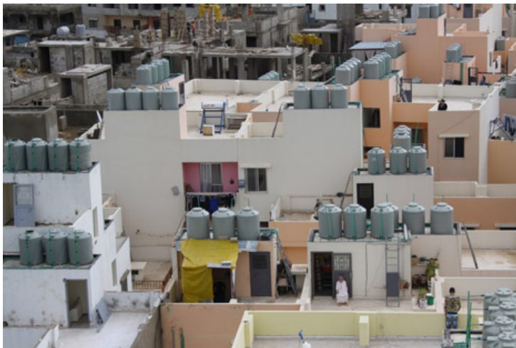
Campo profughi Nahr el-Bared,