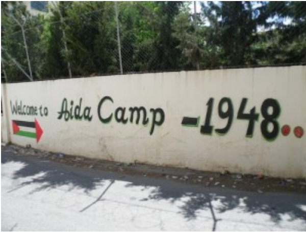
Entrata del campo profughi Aida, Betlemme