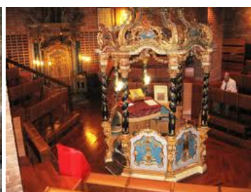
Sinagoga V Secolo