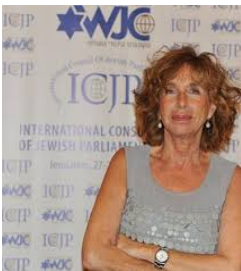
Fiamma Nirenstein , scrittrice, giornalista, corrispondente Il Giornale