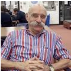
Dan Bahat , archeologo tra i più famosi in Israele