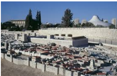
Museo di Israele

Visita facoltativa alla Chiesa della Natività a Betlemme (prenotazione al momento dell'iscrizione)