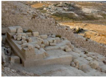
Monte degli Ulivi