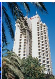
Hotel Crowne Plaza