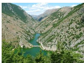
Valle del Giordano