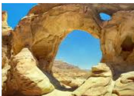
Valle di Timna

Proseguimento per la Valle di Timna , antiche miniere di rame del Re Salomone e visita del Parco Geologico .