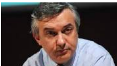
Maurizio Molinari , scrittore, giornalista, corrispondente da Israele e Medio Oriente La Stampa