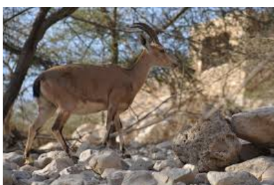
Stambecchi di Ein Gedi