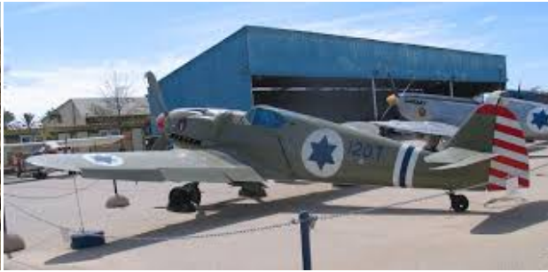
Base aeronautica Hatzerim