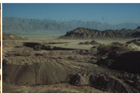
Miniere di rame del Re Salomone