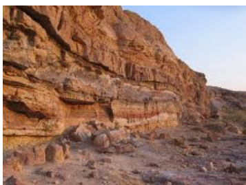
Cratere di Ramon

Visita e attraversamento del Cratere di Ramon , grande parco geologico dove si possono ammirare le stratificazioni della crosta terrestre nei vari periodi di formazione della Terra. In Israele ci sono tre esempi di crateri geologici che prendono il nome di Makhtesh , e quello di Ramon è il più esteso. Durante il percorso si potranno ammirare le formazioni rocciose di vari colori e minerali che caratterizzano questo territorio.