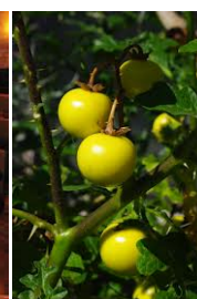
Pomo di Sodoma