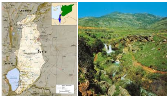
Altire del Golan

Proseguimento per le alture del Golan , confini nord/nord-est con Siria e Libano .