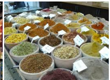
Mercato arabo (Suk)

Ore 18:00 Conferenza di Maurizio Molinari .