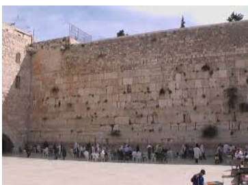
Muro Occidentale (Kotel)