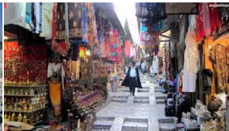
Mercato arabo (Suk)