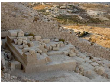
Herodion, Tomba di Erode