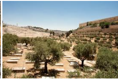
Valle di Giosafat

Nel pomeriggio visita del Santo Sepolcro .