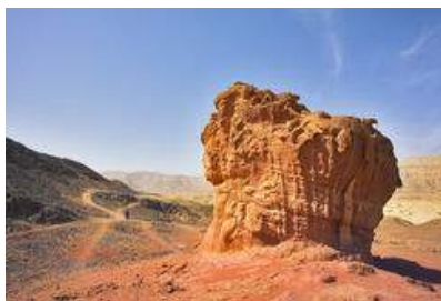
Deserto di Aravà

Ein Hazevà , scavi del periodo midianita nel deserto di Aravà . “ Via della Pace ” al confine con la Giordania . Sodoma , montagna di sale a sud del Mar Morto.