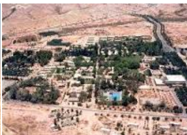
Kibbutz Sde Boker