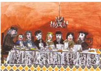
Cena di Shabbat (Lele Luzzati)

“ Cena di Shabbat ”, ospiti presso famiglie di origine italiana , pernottamento in Hotel.