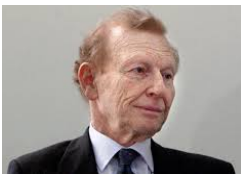
Zvi Mazel , già Ambasciatore in Egitto, esperto nelle relazioni con il mondo arabo