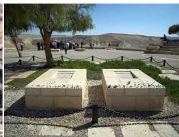
Tomba di Ben Gurion