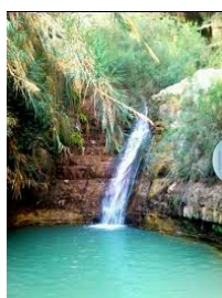
Oasi Ein Gedi

Proseguimento per l' Oasi di Ein Gedi , nel deserto della Giudea , sulla riva occidentale del Mar Morto. Riserva naturalistica ricca di storia, si potranno ammirare gli stambecchi e specie vegetali come il pomo di Sodoma , tipici di questa area geografica. Visita alla Sinagoga del V Secolo , l'area riguarda un periodo della storia che va dalla preistoria fino ai giorni nostri.